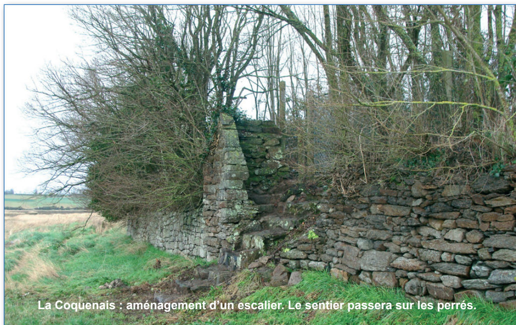
La Coquenais : aménagement d'un escalier. Le sentier passera sur les perrés.

d'avoir à dénoncer régulièrement ces incivilités et de rappeler aux communes qu'elles sont responsables de l'entretien du sentier du littoral sur leur territoire. ■